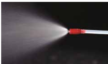
特殊なロングホースで隅々まで洗浄・除菌