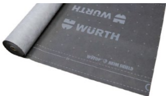
ウートップ® ハイムシールド