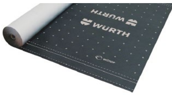
ウートップ® ハイムシールド ルーフ