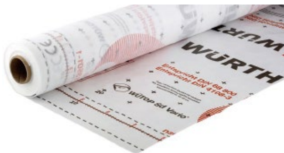
ウートップ® SD ヴァリオ ツヴァイ